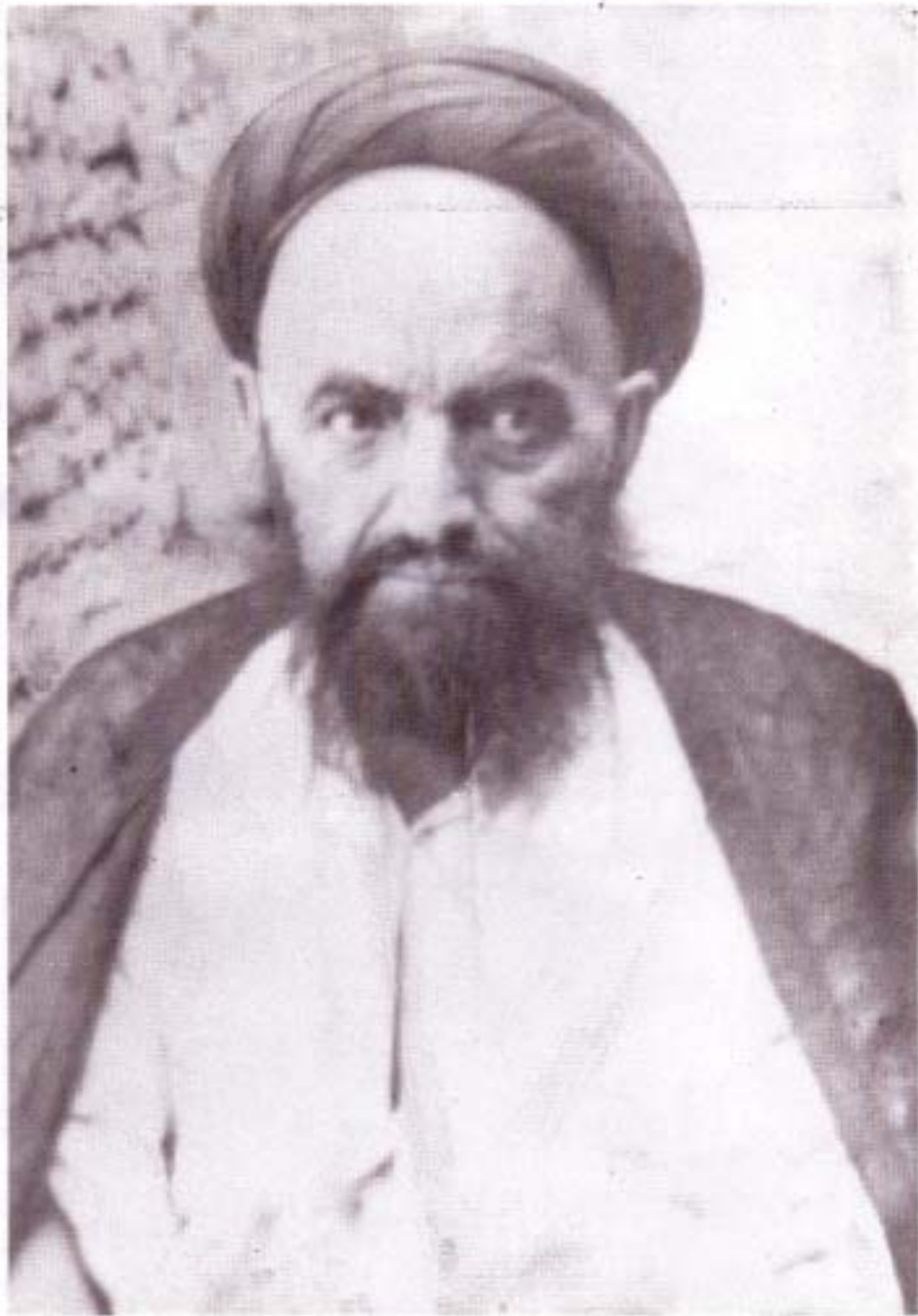
تمثال حضرت آية الله العظمى حاج سيد ميرزا علي قاضي، در سن قريب ۸۰ سالگی